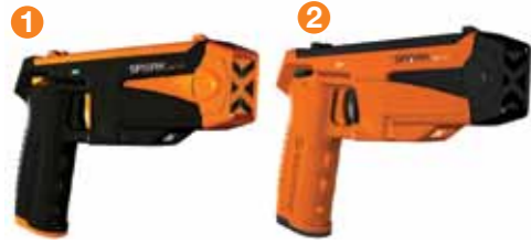
SPARK - DISPOSITIVO ELÉTRICO INCAPACITANTE

Oferecem aos Agentes da Lei dispositivos com alta tecnologia, nas ações de policiamento ostensivo, no combate à criminalidade e nas operações de controle de distúrbios.